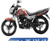
মডেল : ZS 125-68