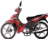
মডেল : ZS VITA 110