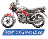
মডেল : TVS MAX 125 cc