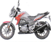
মডেল : Z One 150 cc