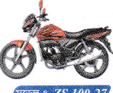
মডেল : ZS 100-27