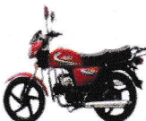
মডেল : ZS 80