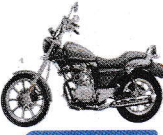
মডেল : ZS 150-58